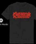
25 Une t-shirt Kreator