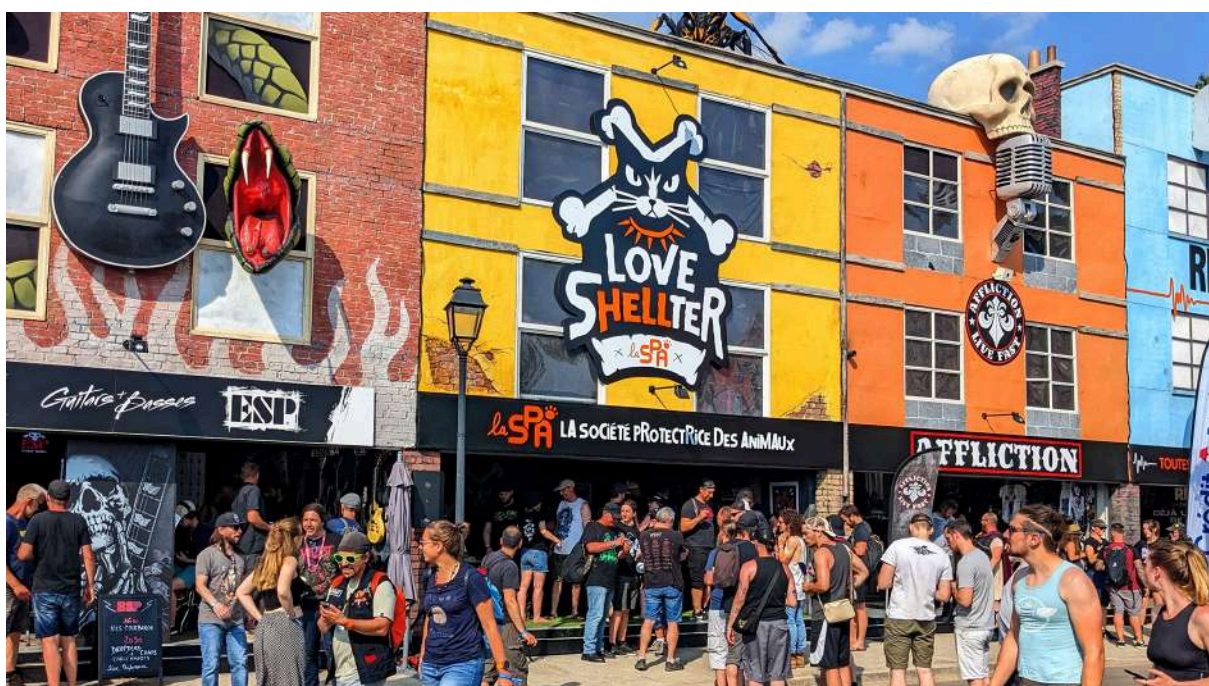
Stand la SPA au Hellfest 2023

“ L’enthousiasme et la générosité des festivaliers et des artistes l’année dernière ont été incroyables. Avec la SPA, nous avons décidé de continuer sur cette lancée pour faire encore mieux cette année. Le Hellfest et ses participants, souvent perçus à tort comme durs, se sont révélés être de véritables passionnés avec un cœur immense, prêts à soutenir les animaux de refuge. Cette année encore, nous voulons mettre en lumière cette alchimie unique entre les métalleux et les animaux.”