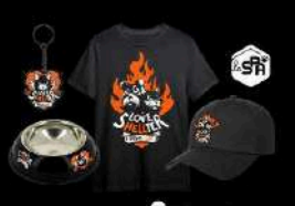
34 Un lot de goodies La SFN + Helefest