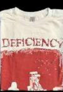
11 Un lot de goodies Deficiency