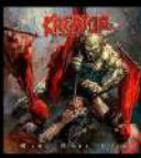
26 Un vinyl dédié par Kreator