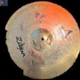
14 Une cymbale dédiée par STINKY