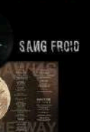
33 Un lot de goodies La SFN + Helefest