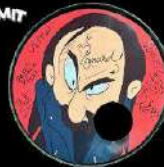
1 Un livret dédié par ULTRA VOMIT