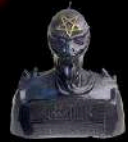
23 Une buste Kreator