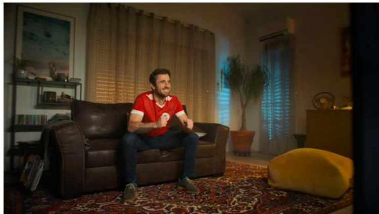
Découvrir le 3ème film ici