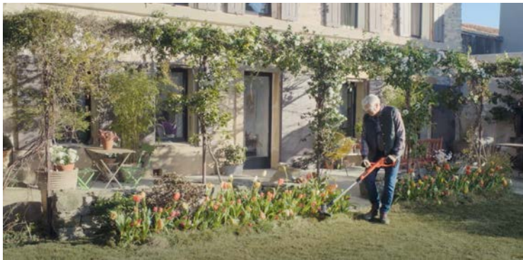
Découvrir le 1er film ici