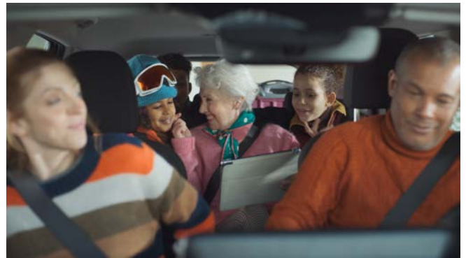
Découvrir le 2ème film ici