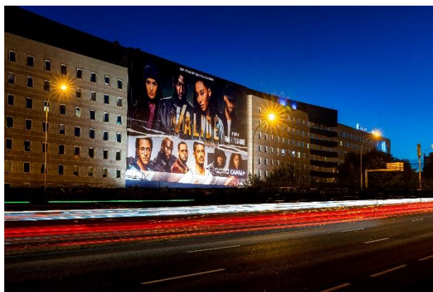
La bâche à Paris