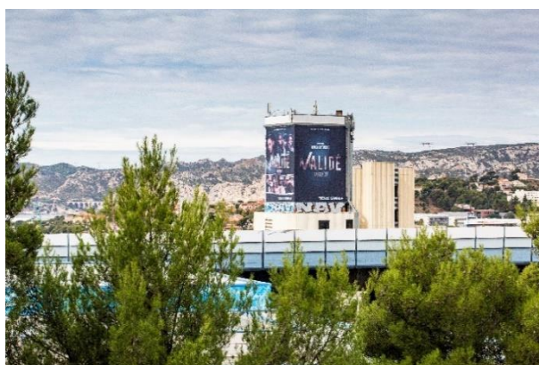
La bâche à Marseille